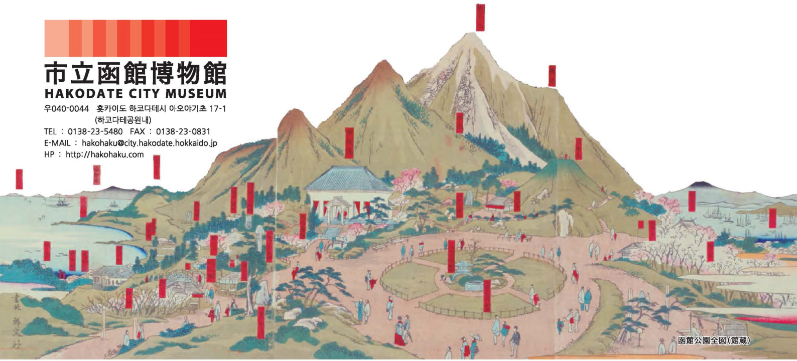
函館公園全区(館藏)

TEL : 0138-23-5480 FAX : 0138-23-0831 E-MAIL : hakohaku@city.hakodate.hokkaido.jp HP : http://hakohaku.com