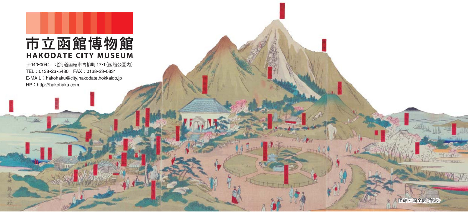
函館公園全図(館蔵)

〒040-0044 北海道函館市青柳町17-1 (函館公園内) TEL : 0138-23-5480 FAX : 0138-23-0831 E-MAIL : hakohaku@city.hakodate.hokkaido.jp HP : http://hakohaku.com